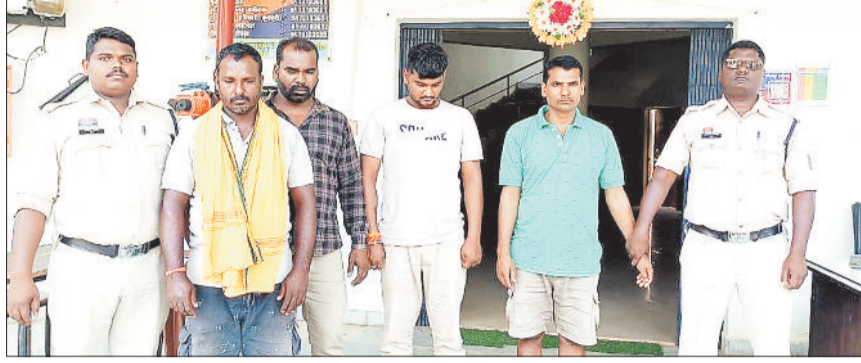
पुलिस हिरासत में आरोपी।

दौरान जब पुलिस ने संदिग्ध पिकअप वाहन को रोकने की कोशिश की, तब तस्करों ने वाहन की रफ्तार बढ़ा दी। पुलिस ने पीछा किया तो उसी बीच पुलिस की रेकी कर रहे तस्करों की बोलरो गाड़ी पुलिस और पिकअप के बीच आ गई, जिससे गौवंशों से भरी पिकअप जंगल की ओर भाग