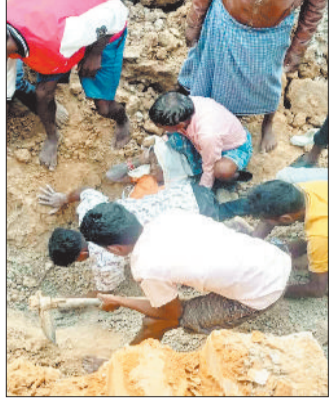
मिट्टी में दबी महिला, निकालते लोग।