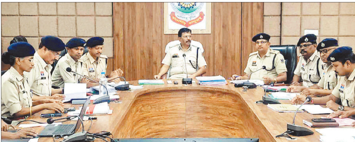
अधिकारियों से चर्चा करते एसएसपी।

फ्राड के पीड़ित को खुद के साथ घटित फ्राड की जानकारी को साझा करने हेतु प्रोत्साहित कर जागरूकता फैलाने, सड़क दुर्घटना के जोखिम को कम करने ब्लैक स्पॉट पर सुरक्षात्मक उपाए कराने, नियमित रूप से वाहन चेकिंग कर लापरवाहों पर सख्ती बरतने एवं नशीली दवाओं और मादक पदार्थों के व्यापार पर कड़ी कार्रवाई करने के निर्देश पुलिस अधिकारियों को दिए। एसएसपी ने लंबित अपराध एवं शिकायतों की समीक्षा कर निराकरण में तेजी लाने के निर्देश देते हुए थाना प्रभारियों से कहा कि आज का दौर तकनीक का है जो तकनीकी रूप से सक्षम होगा। अपराधों के कायमी के बाद समयसीमा 30-60-90 दिवस के भीतर अनिवार्य रूप से अभियोग पत्र न्यायालय में पेश करें। साइबर फ्राड के मामलों में गिरफ्तार आरोपियों की लिंकेज डिटेल जानकारी पोर्टल पर अनिवार्य रूप से अपलोड करने एवं साइबर फ्राड के शिकायत पर तत्काल एक्शन लेने के निर्देश दिए ताकि पीड़ित की आर्थिक क्षति को कम किया जा सके। इस दौरान अतिरिक्त